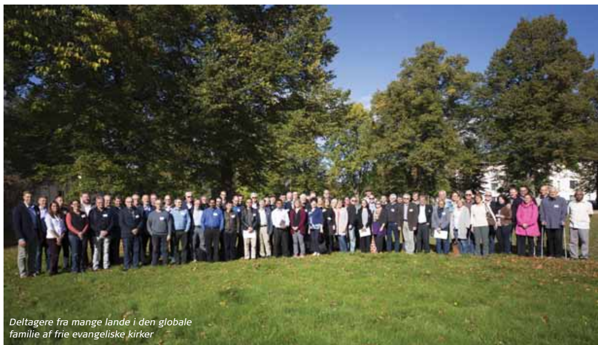
Deltagere fra mange lande i den globale familie af frie evangeliske kirker

Sammen er vi langt stærkere end summen af de enkelte menigheder