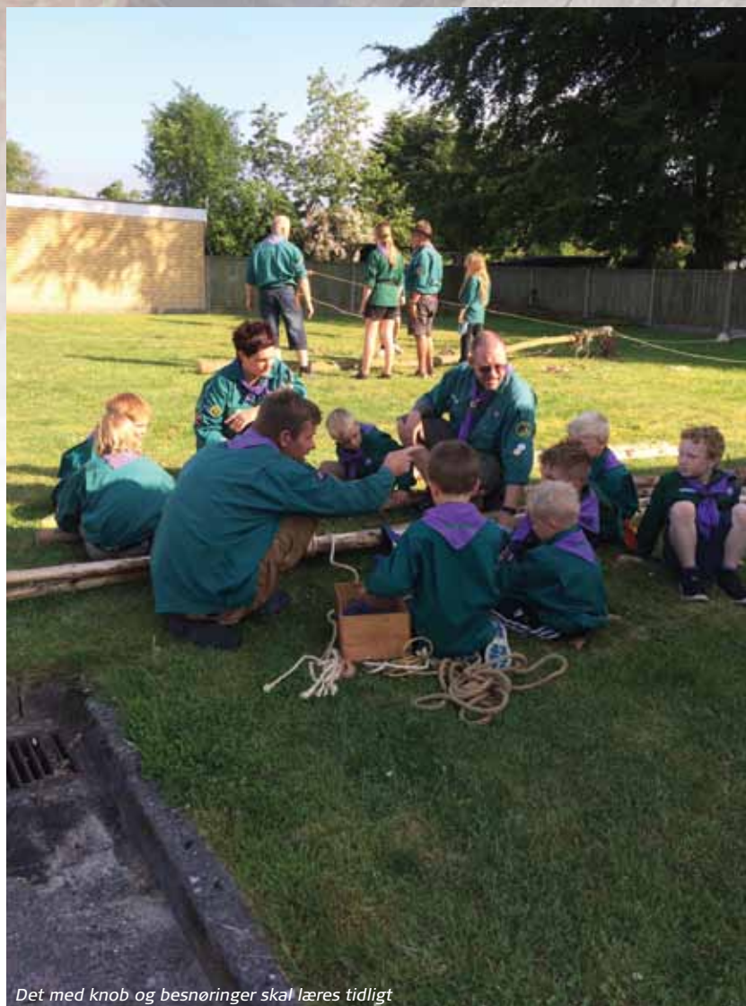
Det med knob og besnoringer skal læres tidligt

Og spejderarbejde har den fantastiske kvalitet, at der udvikles gode ledere nærmest helt af sig selv. Så i hvert fald i Tylstrup er ledermangel i spejderarbejdet et ukendt fænomen.