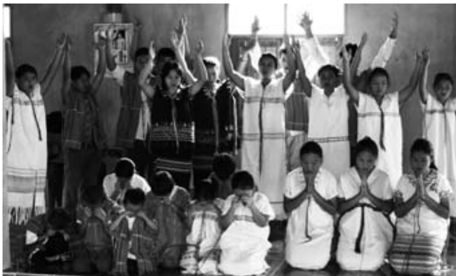
Børnene synger "Cum bay jah, my Lord".

På vores tur var indlagt et besøg i en lille