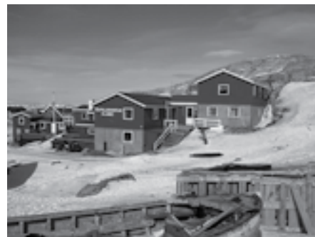
Klubben i Ilulissat.

Men - for at gå i gang med noget - uanset hvilken plan der vælges, så kræver det penge! Menigheden har gennem længere tid ofret til en byggekonto, men de har brug for vores hjælp. Derfor vil 2008 blive året, hvor vi vil forsøge at samle 1/2 million kroner ind. I løbet af året vil jeres menighed få besøg af en eller flere med berøring til Ilulissat. Men begynd allerede nu at overveje, hvordan du selv og din menighed kan støtte drømmene så de må