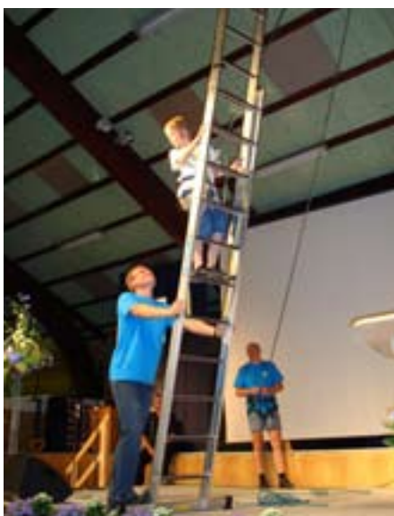
Tro er fast tillid...

Kom – siger Jesus – du som er træt af at bære tunge byrder – og lad mig give dig hvile. Tag ikke alle mulige andre menneskers åg (forventninger og fordringer) på dig – men lad mig give dig livets opgaver og lad mig lægge det åg på dine skuldre,