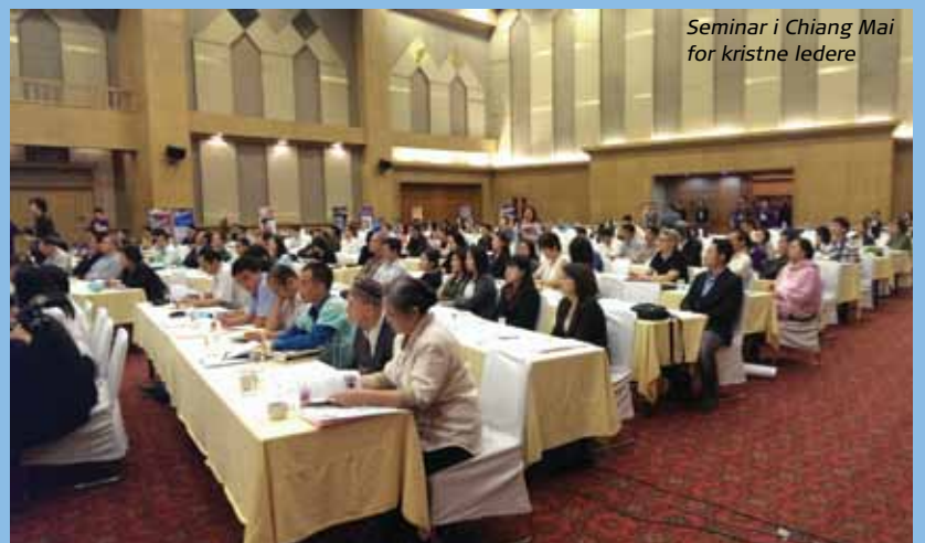
Seminar i Chiang Mai for kristne ledere