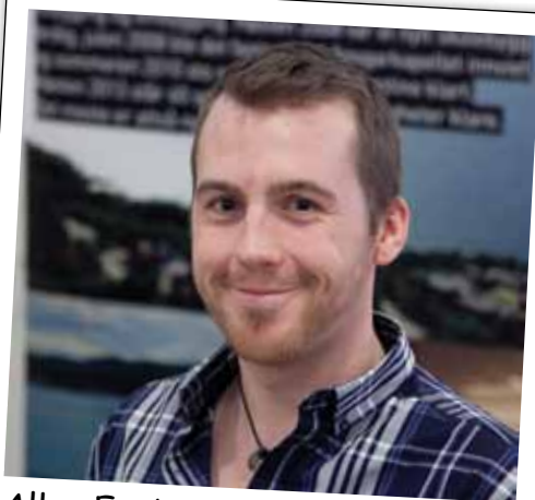
Allan Egeberg Kronborgvejens Kirkecenter, Thisted:

Allerede ved dagens start med rundstykker og kaffe var repræsentanterne fra de forskellige kirker i gang med at snakke visioner og drømme for Missionsforbundet.