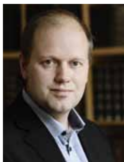
Af Morten Thomsen Højsgaard

2014 er et stort jubilæumsår for Bibelselskabet. Den 22. maj er det 200 år siden, Det Danske Bibelselskab blev stiftet i den gryende guldalders København