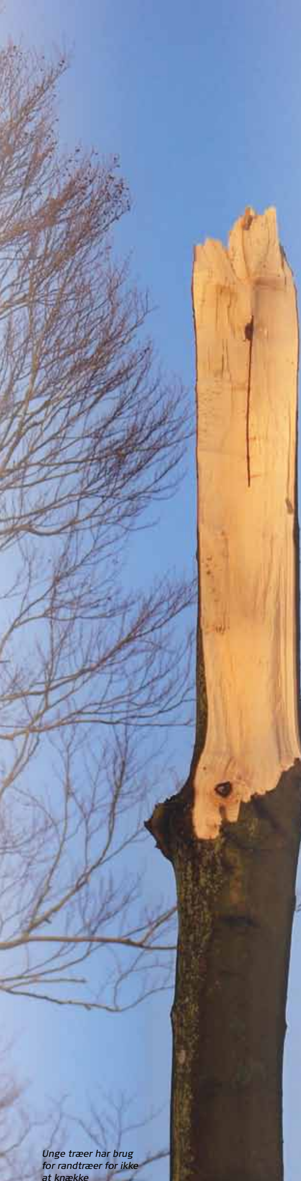
Unge træer har brug for randtræer for ikke at knække

Endelig er jeg der i mit livsforløb, at jeg er lykkeligt gift, har store, næsten voksne, børn og ikke har planer om at skulle flytte eller skifte job. Så i al beskedenhed føler jeg også, at jeg kan bidrage med noget kontinuitet til MBU.