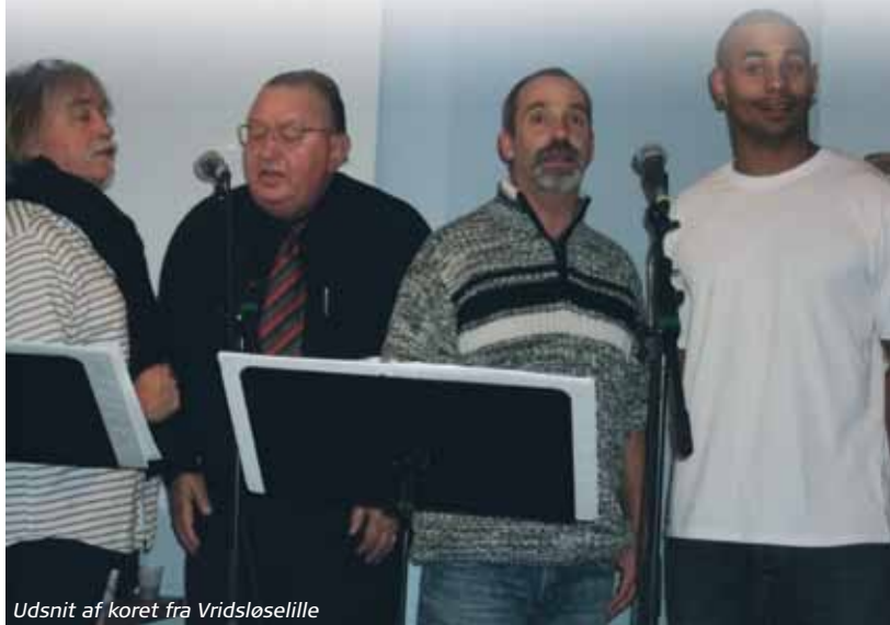
Udsnit af koret fra Vridsløselille