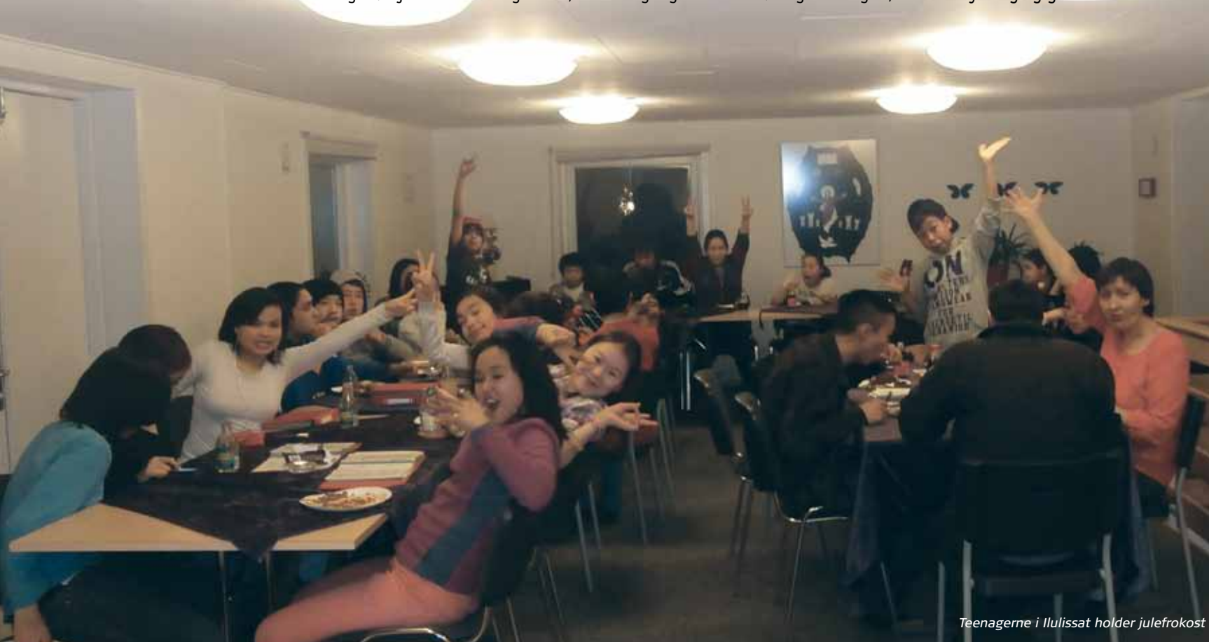
Teenagerne i Ilulissat holder julefrokost

I hele uge 2 har der været bøn og faste – med samling hver aften. Der har været nogen tilslutning, og det har været til stor velsignelse for dem, der har deltaget. Herren har talt på mange områder, især om at rejse sig – tage Gud på ordet samt løfter om, at han vil kalde mange tilbage til menigheden, men især, at der er nogen, der må rejse sig og gå .