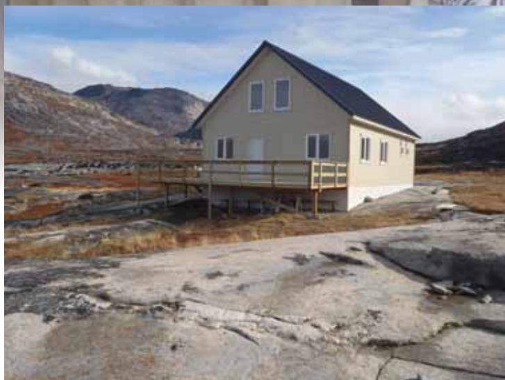
Hytten i Kangersuneq fik besøg af fire halvgamle mænd, men det resulterede i en flot ny terrasse i løbet af to døgn.