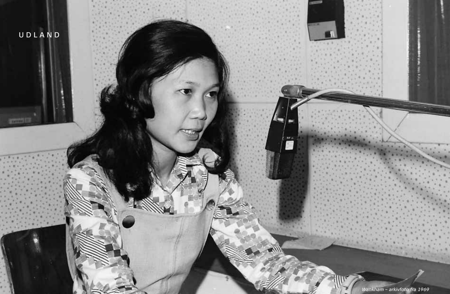
Wankham – arkivfoto fra 1969