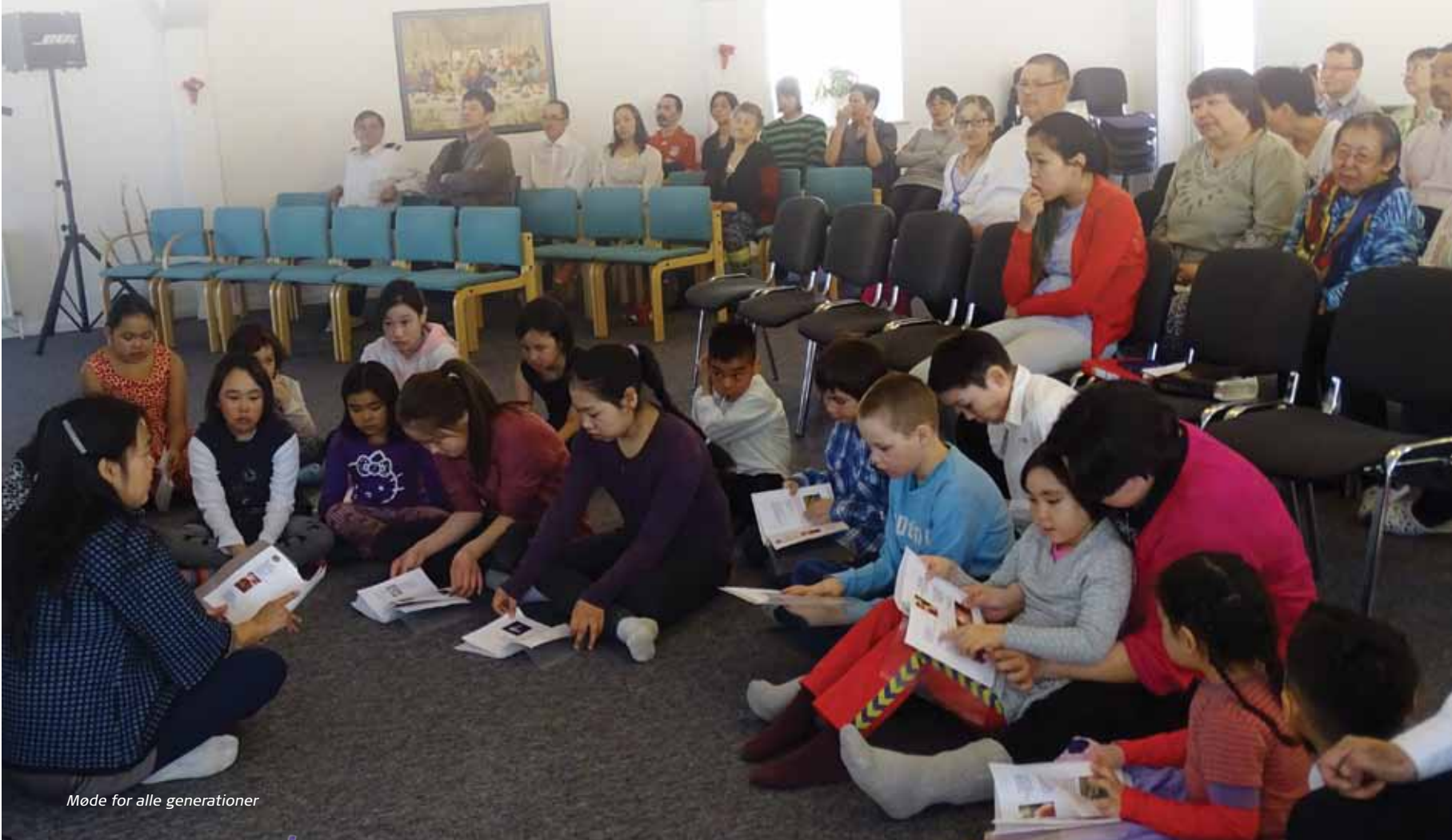
Møde for alle generationer

Vi rejste til Grønland og troede, vi skulle give, men vi rejste hjem rigere, end da vi kom.